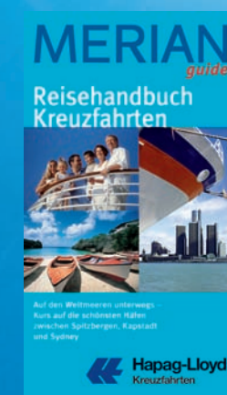
MERIAN GUIDE „REISEHANDBUCH KREUZFAHRTEN“