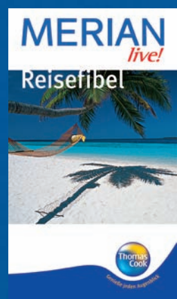
MERIAN LIVE! „REISEFIBEL“

Nutzen Sie die einzigartige Kompetenz von MERIAN auch für Ihre Marke! Wir informieren Sie gerne über die Möglichkeiten – einige Beispiele finden Sie hier: