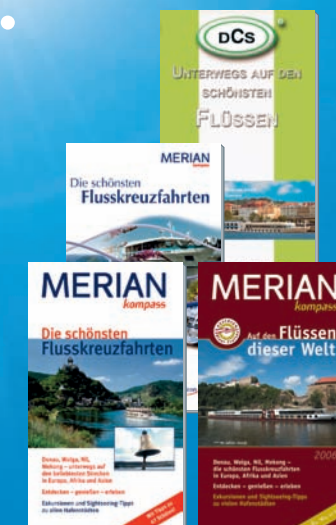
MERIAN KOMPASS „DIE SCHÖNSTEN FLUSSKREUZFAHRTEN“