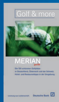
MERIAN GUIDE „GOLF & MORE“